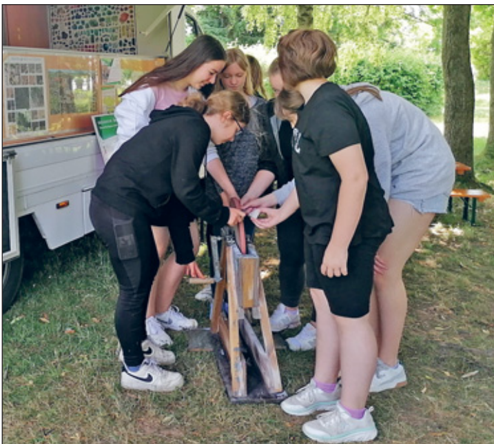
Das Gesteinslabor vom Geopark

Bei den Zehntklässlern stieg die Anspannung aufgrund der anstehenden mündlichen Prüfungen und so manch einer dachte vielleicht noch einmal an sein erstes, nun bereits zwei Jahre zurückliegendes Betriebspraktikum zurück. So war es auch wieder Anfang Juni, als es für die über 60 Mädchen und Jungen der 8. Klassen hieß, die Schultasche mit der Arbeitskleidung zu tauschen, erste Erfahrungen als Praktikant in der Arbeitswelt zu sammeln und dabei vielleicht auch festzustellen, dass Schule eigentlich auch ganz schön sein kann.