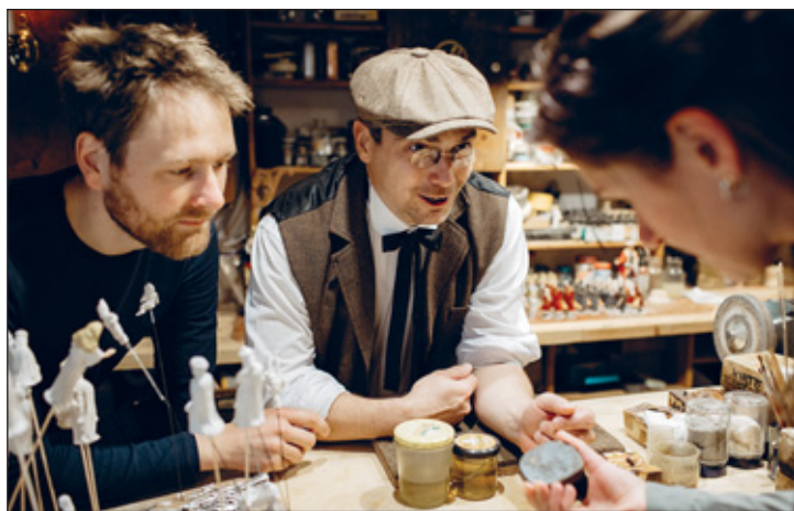
Lahl Massefiguren Annaberg-Buchholz

Vom Bergschmied bis zum Glasbläser, vom Drechsler bis zum Posamentierer – vielerorts können Sie echte Werkstattluft schnuppern und authentisches Traditionshandwerk in