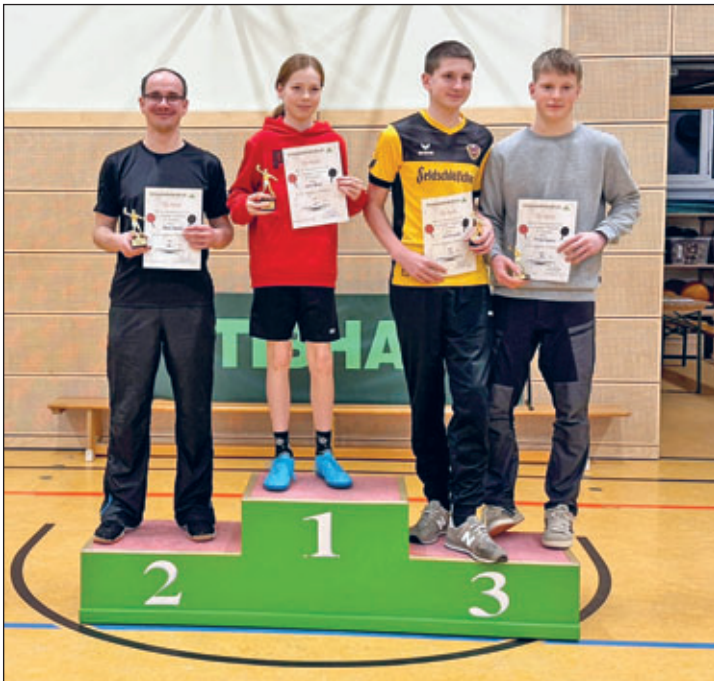
Siegerehrung der Nichtaktiven