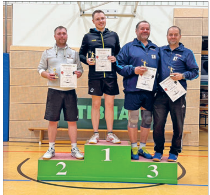
Siegerehrung der Aktiven